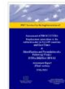
Assessment Report - PROCULTURA - Employment generation in the cultural sector in PALOP countries