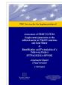
PROCULTURA Assessment Report - 2022