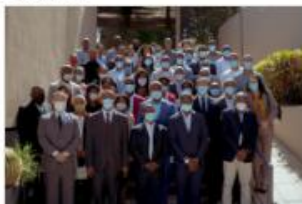
Workshop das Instituições Superiores de Controlo das PALOP para a Atualização do Quadro de Reporte de Gestão das Finanças Públicas